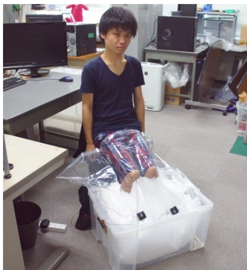
図 3 両足への触覚呈示 Figure 3 Vibrotactile display for legs.

前腕部用のシステムと同様の構成で、他の部位に触覚呈示を行うプロトタイプも製作した。両足全体用のシステムを図 3 に示す。ビーズと身体を直接接触させることなく、ビーズの入った密閉袋を胴体に巻きつけ、袋の上から胴体全面に触覚呈示を行った例を図 4 に示す。ビーズが入ったマットを身体に巻きつけ、減圧して固定・装着する仕組みは、傷病者の欠損部位を固定するための救命救急器具としてすでに実用化されている[10]。したがって本手法でも身体形状への適応性は高いと考えられる。ただしビーズ内に身体を入れる場合に比べ身体を締め付ける圧力が弱く、受容される振動強度は低下することが確認された。