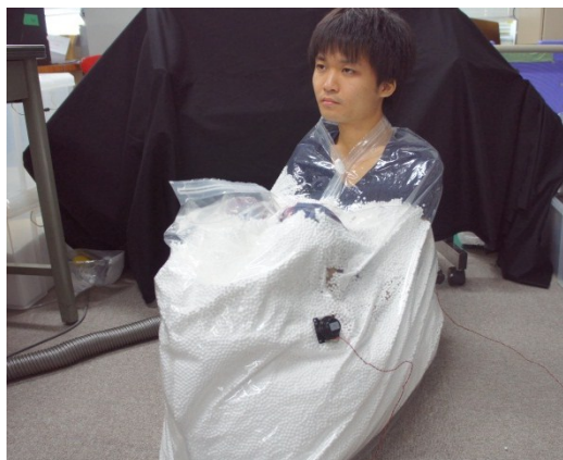
図5 全身への触覚呈示

首から下の身体全てをビーズに浸すことで、身体表面全てに触覚呈示を行うことも検討した(図5)。これにより、従来は難しかった頭部以外の全身にうまく触覚呈示することも可能である。