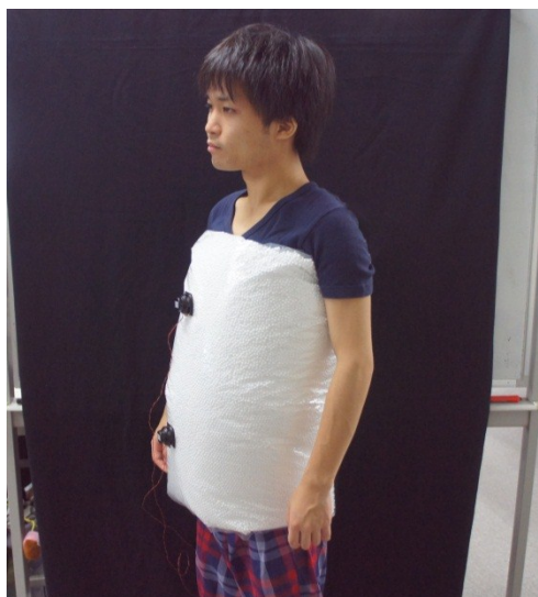
図 4 胴体への触覚呈示 Figure 4 Vibrotactile display for torso.