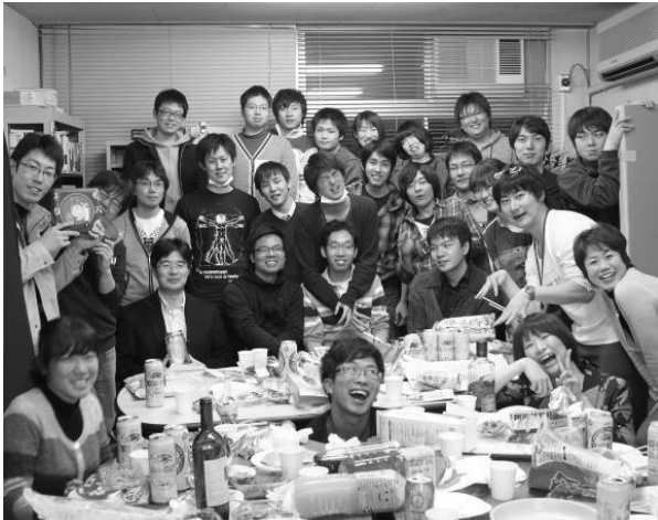
2010 年度送別会の様子