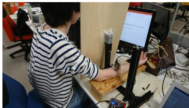
図 3 実験環境

各試行において基準刺激を提示した後に比較刺激を提示した。その後、被験者にどちらの刺激が強かったかを強制二択によって回答させた。比較刺激は、錘をつけない状態から一定間隔で大きくする上昇系列と、基準刺激に対し十分に大きい強度から一定間隔で小さくする下降系列をこの順で行った。上昇系列で得られた閾値と下降系列で得られた閾値の平均を記録した。