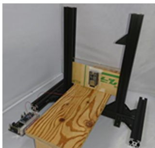
図 1 開発した機械刺激装置

また、電気刺激を提示するための電気刺激キット[7]を図 2 に示す。このキットにはマイクロコントローラ (NXP Semiconductors, mbed NXP LPC1768)、高速 D/A 変換及び電圧電流変換回路が利用され、刺激電流の波形を制御することができる。電極は陰極側が縦 0.5cm、横 3cm の導電性ゲルに電線をとりつけたもの、陽極側は導電性粘着ゲル (日本光電社, ディスポ電極 F ビトロード) である。陰極を刺激電極として、陽極を不関電極として用いた。