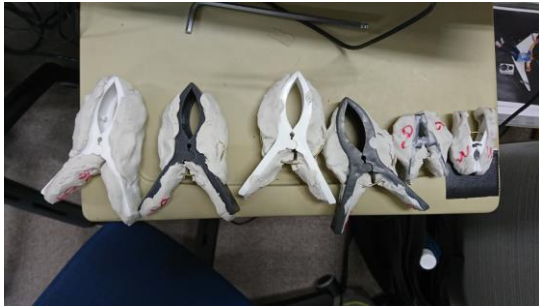
図 4 比較刺激強度を変えるための錘

実験条件は電気刺激の強度（電流パルスの高さ）を閾値の 1.0, 1.2, 1.4, 1.6, 1.8 倍とした 5 条件とした。それ以外の電気刺激に関するパラメータは同一で、パルス幅 200us、周波数 50Hz とした。一回の機械刺激に対して同時に提示したパルスは 5 つであり、電気刺激は 100ms 間提示された。各条件において、上昇系列と下降系列は各 1 回ずつ行った。実験条件の実施の順番はランダムとした。