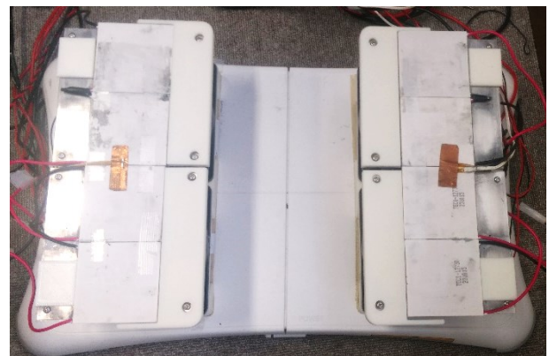
図 1 実験システム

実験に用いたシステムを図 1 に示す。システムは 2 台の温度刺激提示装置と、重心動揺計(バランス Wii ボード[2])から構成される。温度刺激提示装置はペルチェ素子 (TEC1-12730) およびヒートシンク、冷却ファン、フィルム状サーミスタから構成される。被験者の皮膚に接触するペルチェ素子表面の温度はサーミスタにより計測され、モータードライバによって PID 制御された。重心動揺計により計測されたデータ (サンプリング周波数 100Hz) はバランス Wii ボード用プログラム FitTri により重心座標データに変換された。