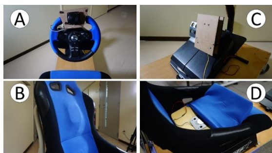
図 2 振動子の取り付け位置詳細