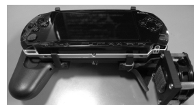
図 1. PSP に振動子を組み込む

装置は携帯ゲーム機 PlayStation Portable (PSP) に振動刺激子としてスピーカー (LF040P1-S) を取