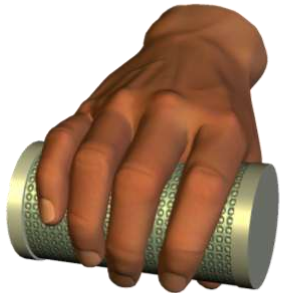
Fig. 1 Image of cylindrical master hand using electrocutaneous display.

以上の考察から、本研究では手で握り込めるサイズの円筒の表面に電極を多数設けた円筒形マスタハンド (Fig. 1) を提案する。