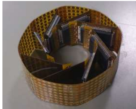
Fig. 3 Cylindrical shape by connecting flexible electrode units.

刺激ユニットを 8 個並べ、刺激電極部分同士を接続すると円筒形状を構成することができる (Fig. 3)。周長は 3\text{mm} \times 8 \text{個} \times 8 \text{ユニット} = 192\text{mm} であり、直径は 61.1\text{mm} である。日常的に握ることの多い飲料缶と比較すると、缶コーヒーの直径 53\text{mm} 、缶ビールの直径 66\text{mm} の中間の値である[14]。強いパワーグリップには大きすぎるものの、自然な手の形に近い手持ち感覚を実現できると期待される。さらにこの円筒形状を 3 個積み重ねると、高さは 3\text{mm} \times 8 \text{個} \times 4 \text{ユニット} = 96\text{mm} となる。日本人の手幅長は平均で 77\text{mm} 、男性の 95 パーセントイルで 88.5\text{mm} であるので、十分に握りこんだ手全体を刺激できると考えられる[15]。なお国内で一般に販売されている飲料缶の最も低背のものは 91.6\text{mm} である[14]。