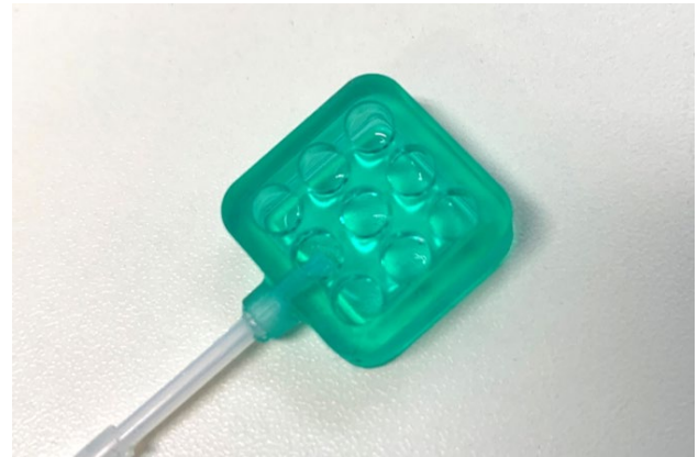
図 1: 吸引部 (UV 樹脂製)

皮膚に痕を残さないために吸引径を小さくし、皮膚変形量を最小限に留める。また最大吸引気圧値は 500hPa を上限とする。吸引部の吸引径は予備実験より多数の試作から選定し、直径 5mm, 中心間距離 6mm とした。複数人で試したところ、顔面において安定的に吸引による圧迫感を提示することが出来た。