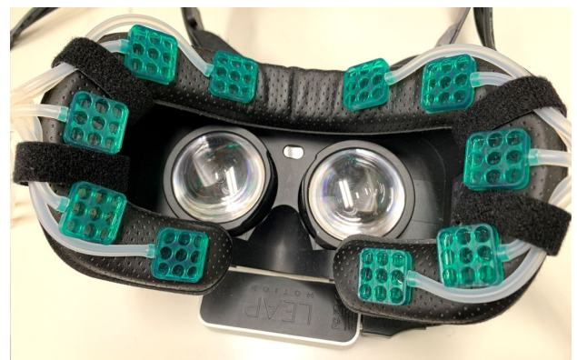
図 3: Haptopus の全体図